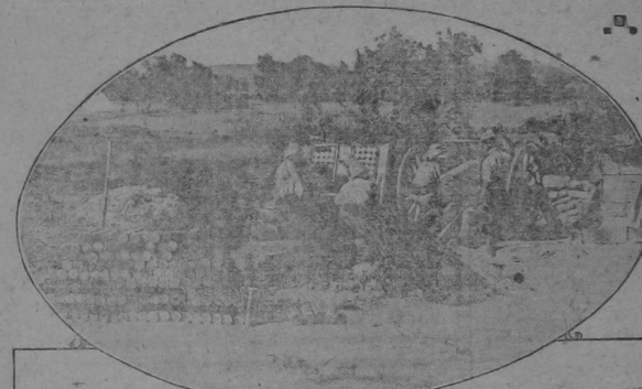
FRENCH BATTERY IN ACTION NEAR SEDDUL-BAHR

The official announcement by the British government that the Allied forces had been withdrawn from Gallipoli except at Cape Helles, the extreme tip of the peninsula, came as a surprise, although it had been known for many weeks that the forces there were deadlocked and had no hope of progressing farther. The withdrawal from Anzac and Suvla Bay was made with a total of only three casualties. The Turks were evidently unaware of the movement until it was nearly completed. After the British announcement was made Constantinople claimed to have driven the enemy into the sea. Most of the men from Gallipoli have been sent to Salonik after a short but well-earned rest. The presumption is that the force at Cape Helles will be strong "another Gibraltar will be created there," but if the position can be held during the war it will partly offset the unexpected success of Turkey in resisting the attack of the Allied armies and navies.